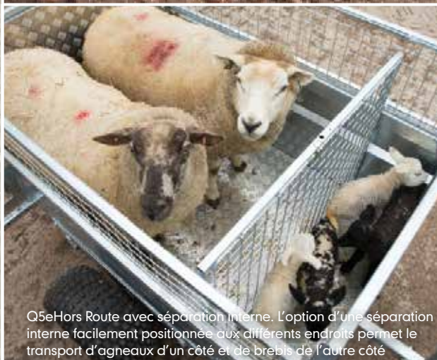
Q5eHors Route avec séparation interne. L'option d'une séparation interne facilement positionnée aux différents endroits permet le transport d'agneaux d'un côté et de brebis de l'autre côté