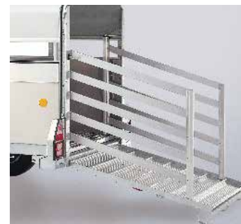
En option: extensions de barrière de pont pour Q6, 7 et 8