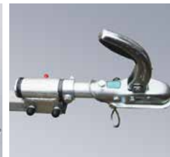
Tête d'attelage pivotante pour utilisation hors route (sans homologation type pour la route)