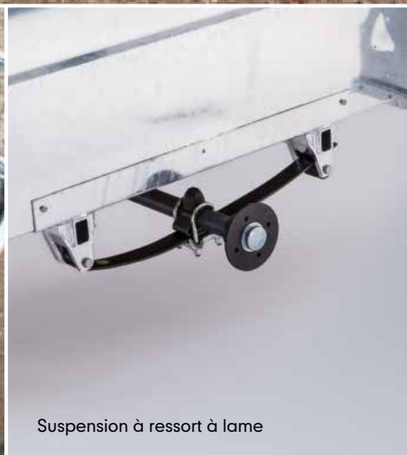
Suspension à ressort à lame