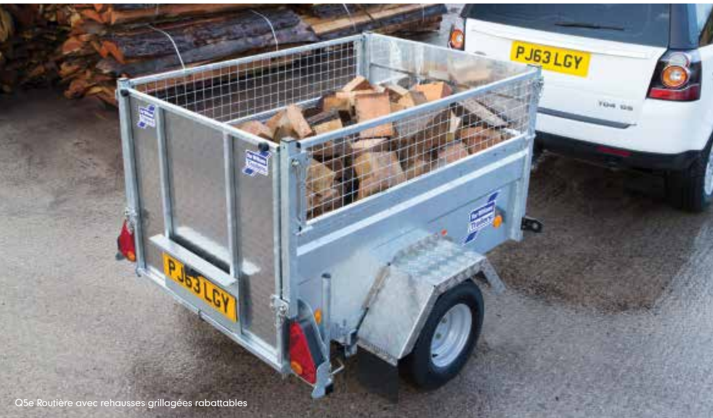
Q5e Routière avec rehausses grillagées rabattables