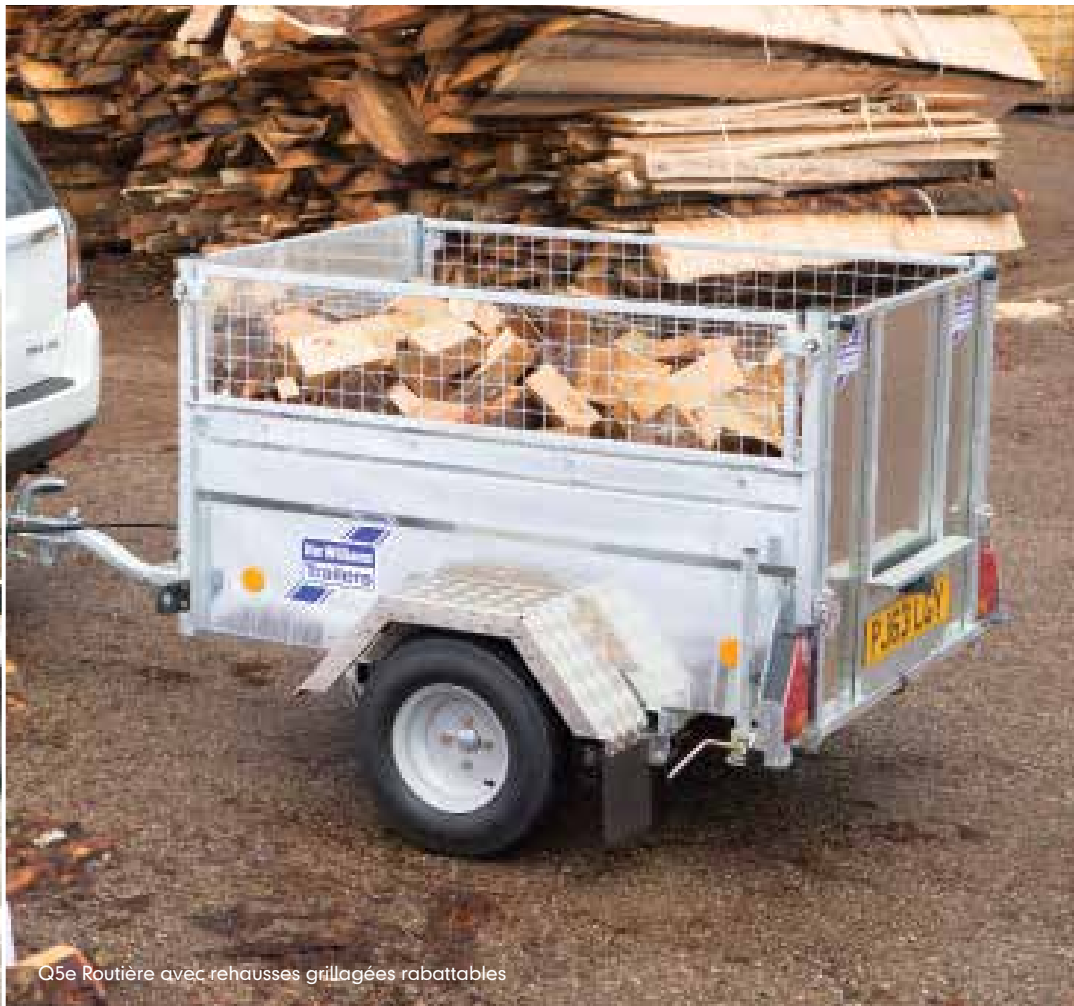
Q5e Routière avec rehausses grillagées rabattables

*merci de vérifier le manuel de l'utilisateur du véhicule pour les renseignements concernant la limite supérieure de tractage non-freiné