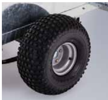
Q5e Hors Route pneus nouveaux (22x11-8)