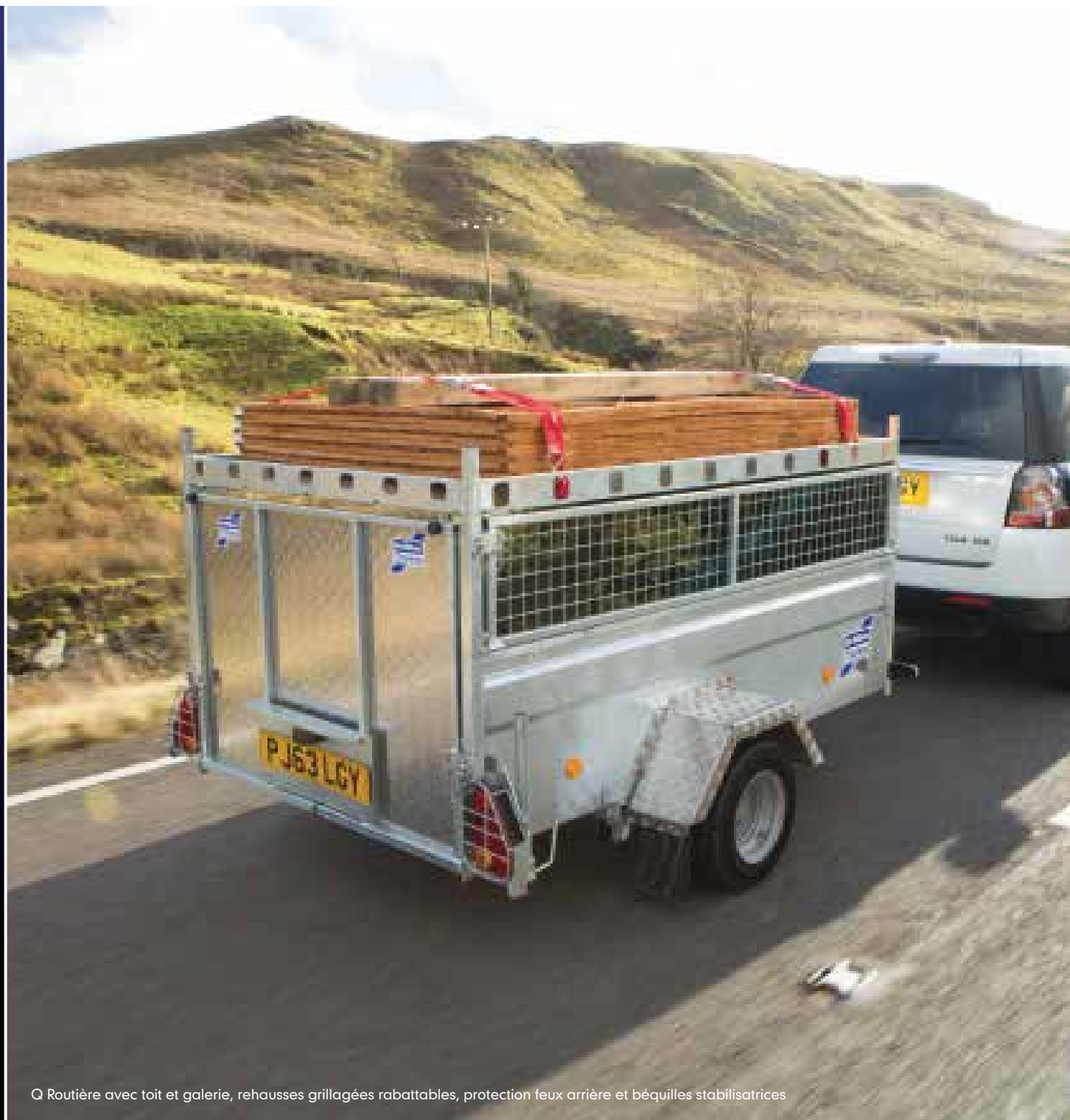
Q Routière avec toit et galerie, rehausses grillagées rabattables, protection feux arrière et béquilles stabilisatrices

Nous sommes une entreprise indépendante avec un seul objectif : construire les meilleurs produits du marché. Plus de 30,000 personnes choisissent nos remorques chaque année, mais nous nous n'arrêtons pas là. L'investissement que nous consacrons aux nouveaux matériaux et aux nouvelles technologies nous permet de continuer de dépasser les attentes de nos clients. Nous savons que la qualité, la robustesse et le rapport qualité/prix et la facilité d'entretien sont pour vous d'une importance cruciale. C'est pourquoi nous en avons fait le fil directeur de toutes nos actions.