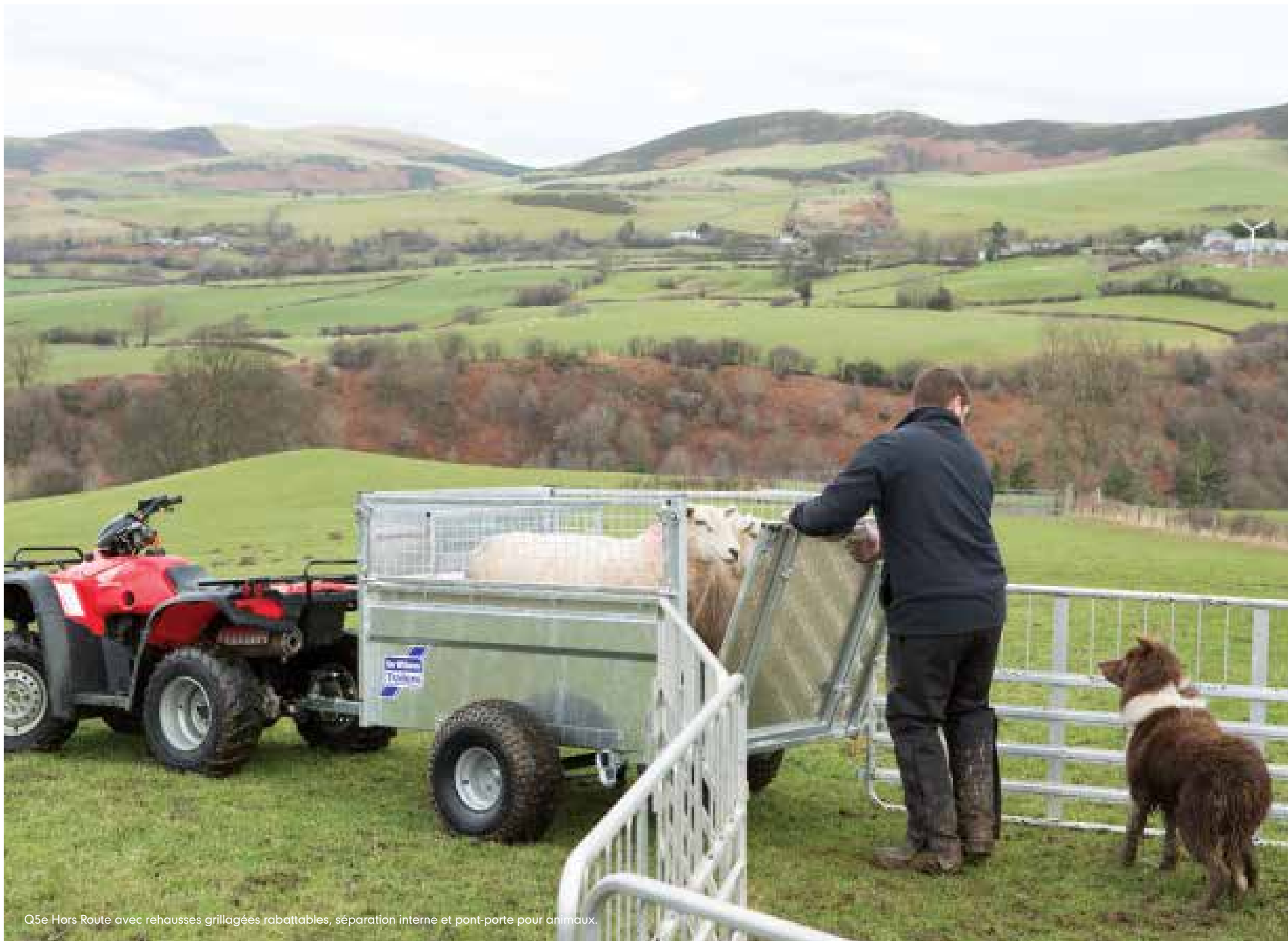
Q5e Hors Route avec rehausses grillagées rabattables, séparation interne et pont-porte pour animaux.