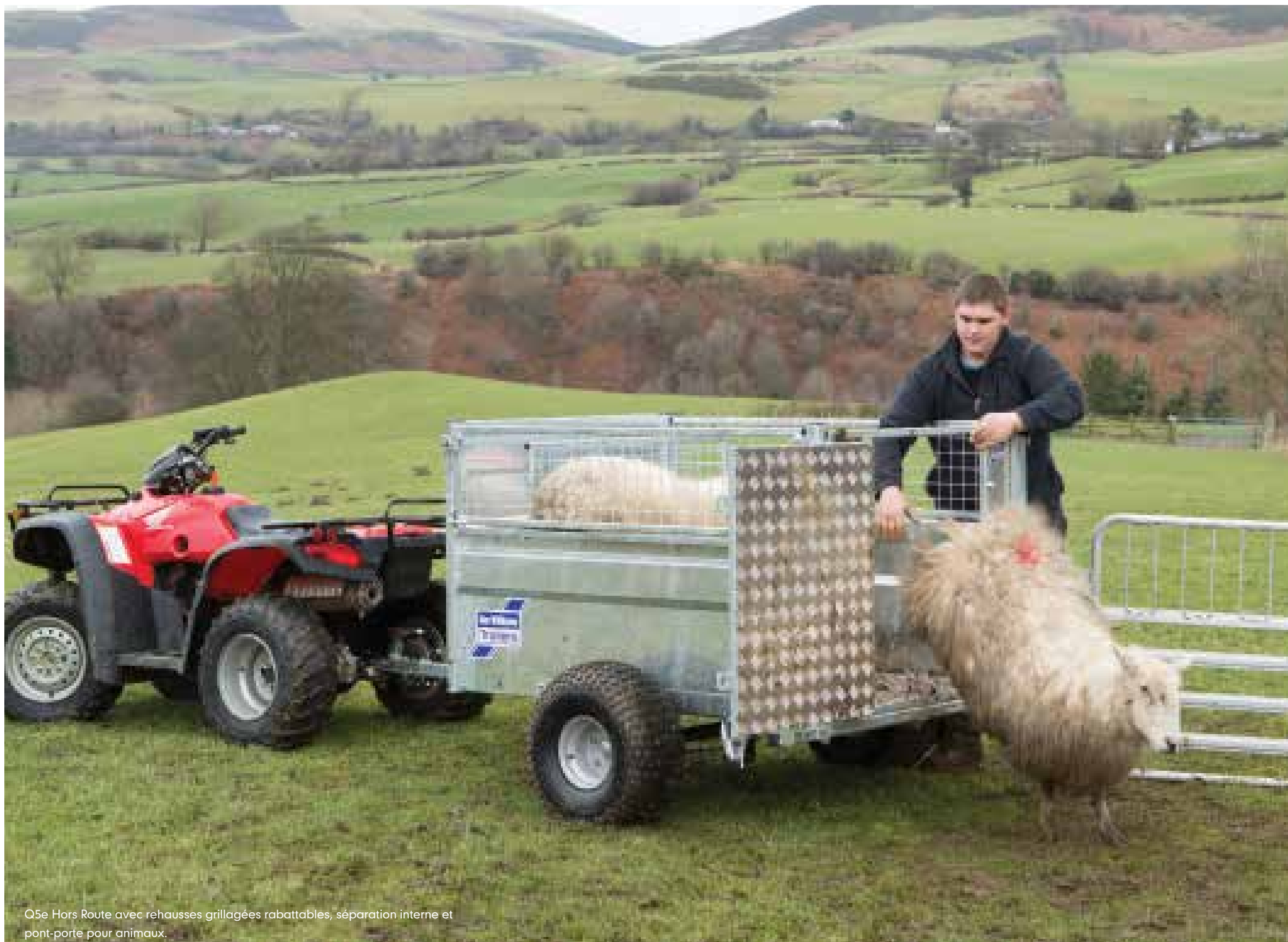
Q5e Hors Route avec rehausses grillagées rabattables, séparation interne et pont-porte pour animaux.