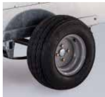
Q5/6/7e Hors Route pneus de flottation (20,5 x 8-10)