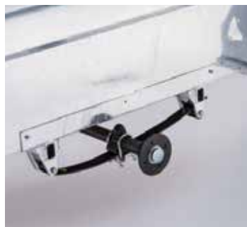
Suspension à ressort à lame est de série