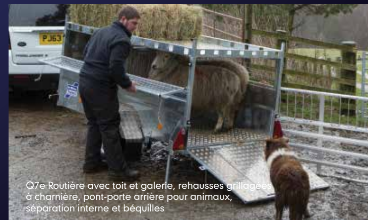
Q7e Routière avec toit et galerie, rehausses grillagées à charnière, pont-porte arrière pour animaux, séparation interne et béquilles

Ils sont fixés sur 2 points afin de les (dé)monter facilement.